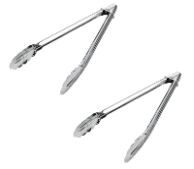
トング2本 使用後洗浄して下さい