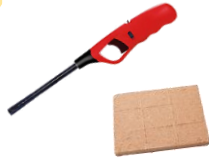
チャッカマン 着火剤